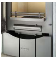
Regulador del aire primario Regulador del aire secundario

El regulador del aire primario se halla a la izquierda y el del aire secundario, a la derecha por debajo de la puerta de carga.