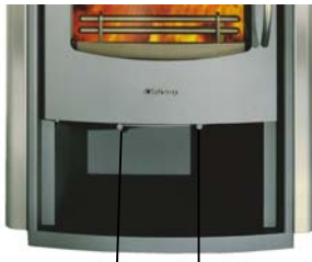
Primaire luchtregelaar Secundaire luchtregelaar

De primaire luchtregelaar bevindt zich links en de secundaire luchtregelaar rechts onder de vuldeur.