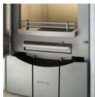
Vérin à air primaire Vérin à air secondaire

Le vérin à air primaire se trouve à gauche et le vérin à air secondaire se trouve à droite sous la porte d'alimentation.