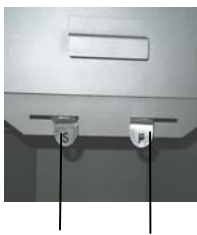
Regulador del aire secundario (S) Regulador del aire primario (P)

El regulador del aire primario (P) se halla a la derecha y el del aire secundario (S), a la izquierda por debajo de la puerta de carga.