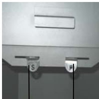
Secundaire luchtregelaar (S) Primaire luchtregelaar (P)

De primaire luchtregelaar (P) bevindt zich rechts en de secundaire luchtregelaar (S) links onder de vuldeur.