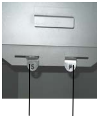
Sekundärluftsteller (S) Primärluftsteller (P)

Der Primärluftsteller (P) befindet sich rechts und der Sekundärluftsteller (S) links hinter der Fülltür.