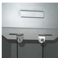
Vérin à air secondaire (S) Vérin à air primaire (P)

Le vérin à air primaire (P) se trouve à droite et le vérin à air secondaire (S) se trouve à gauche sous la porte d'alimentation.