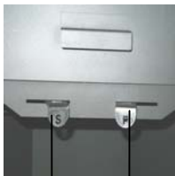
Secondary air controller (S) Primary air controller (P)

The primary air controller (P) is located on the right-hand side of the loading door and the secondary air controller (S) is located on the left-hand side beneath the loading door.