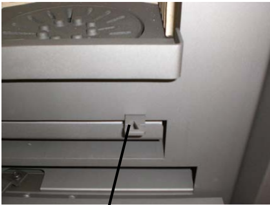
Bedienhebel für den Feuerrost