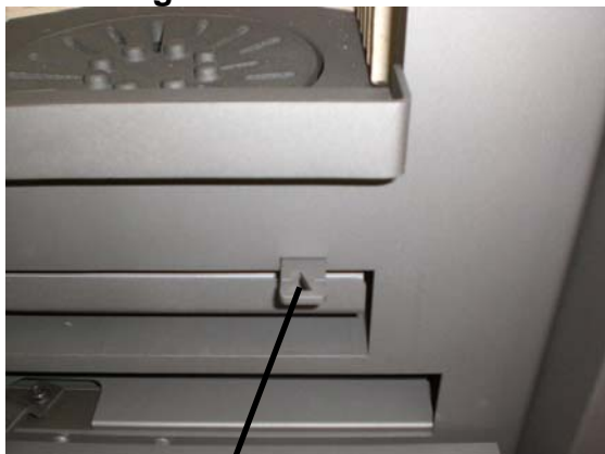
Regelhendel voor het vuurrooster