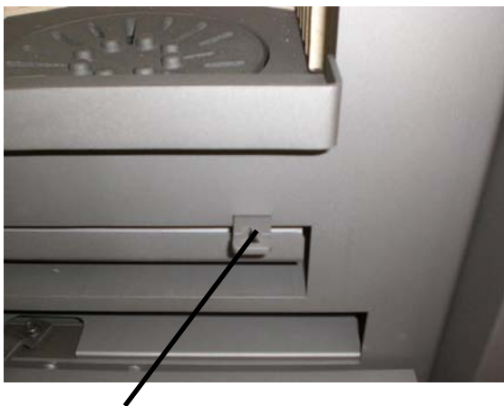
Operating lever for the fire grate

With the help of the lever the grate can be opened or closed to move the ash from the combustion chamber to the ash pan by pushing the grate back and forth. Primary air can only enter the combustion chamber if the grate is set on open position.