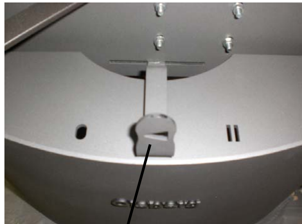
Bedienhebel für die Verbrennungsluftzufuhr