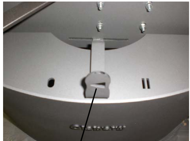
Operating lever for combustion air supply