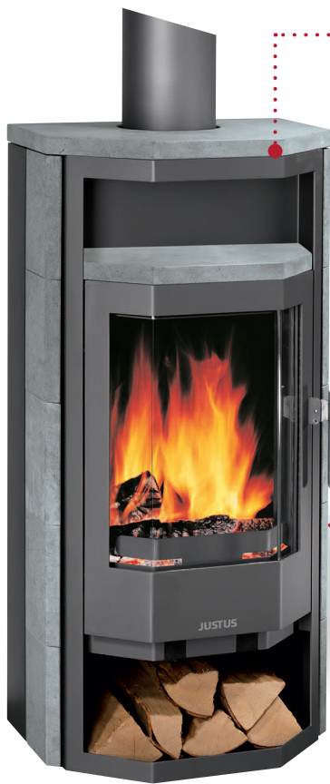
Borkum Speckstein, Korpus Stahl Gussgrau